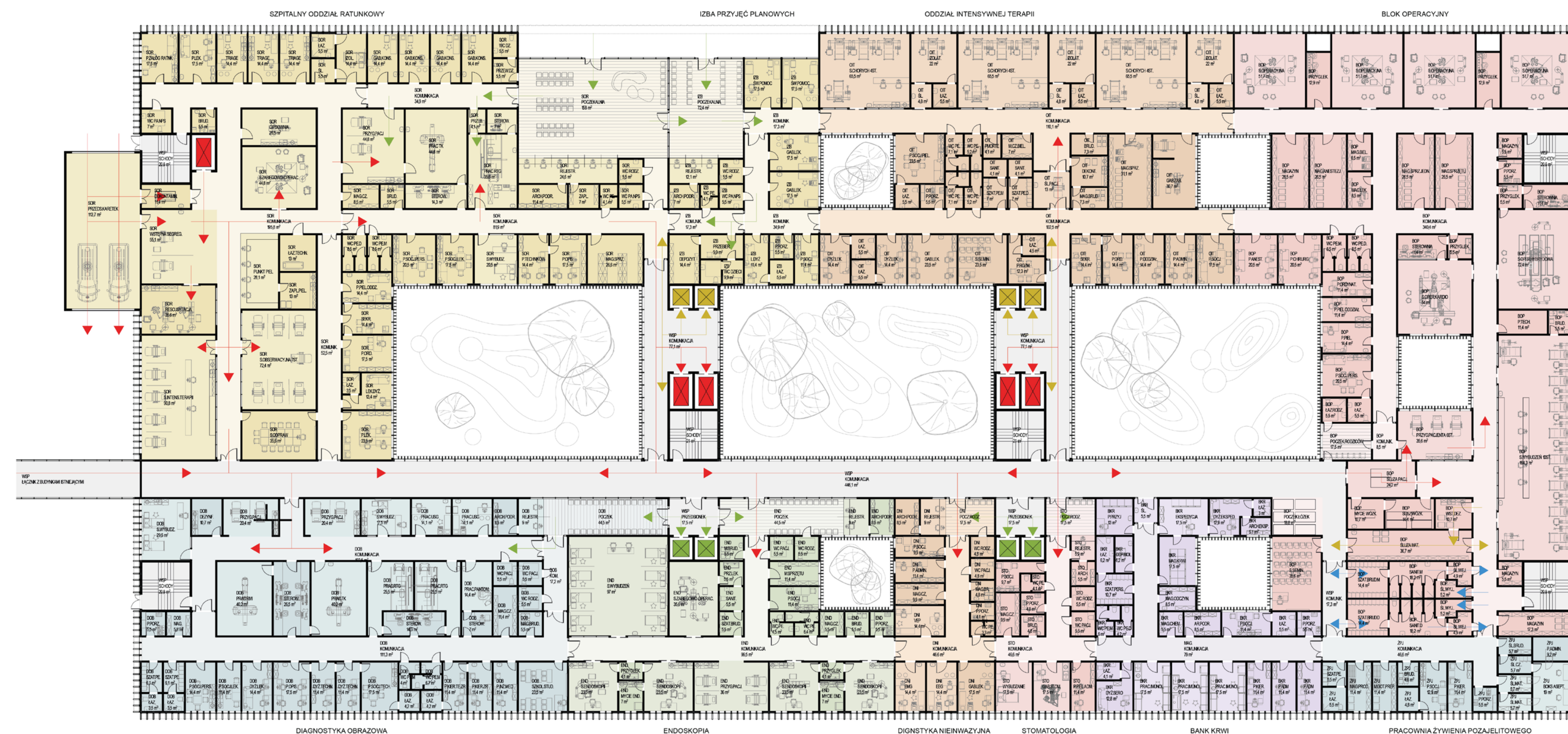
RZUT PARTER SKALA 1:250