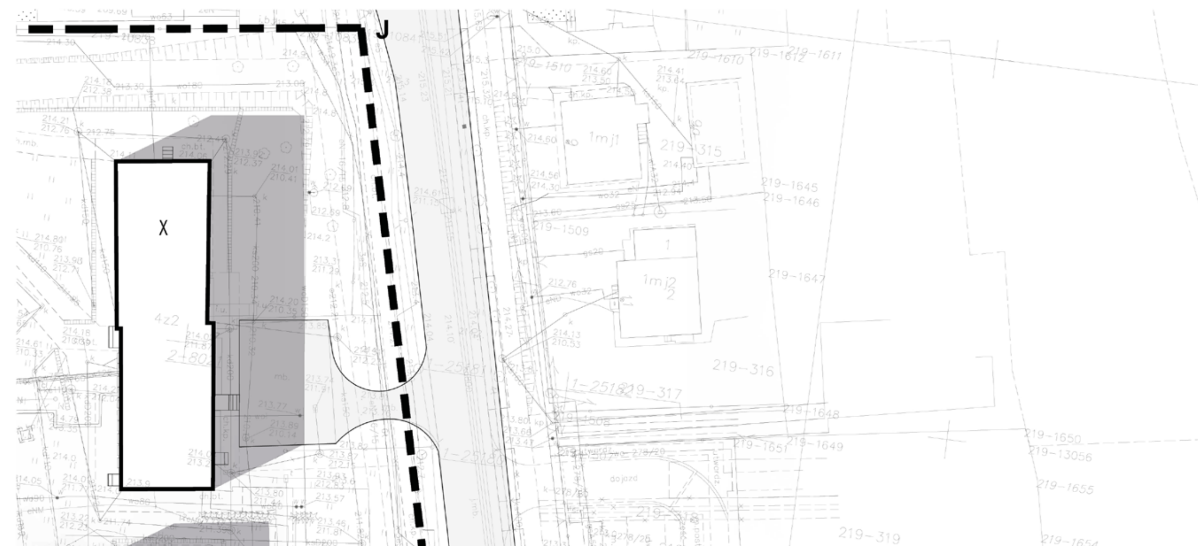
ZAGOSPODAROWANIE TERENU SKALA 1:500